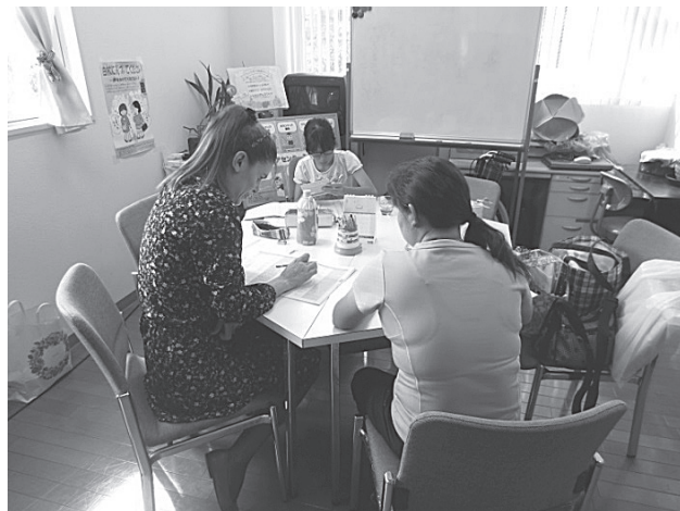
日本語ボランティア