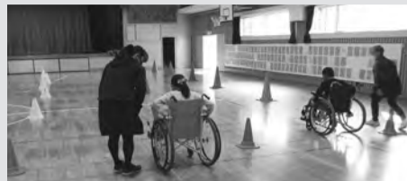
※体験のための福祉用具は、町内の事業所である「ケアサポート尾作設備」のご協力により、お借りしました。本当にありがとうございました。